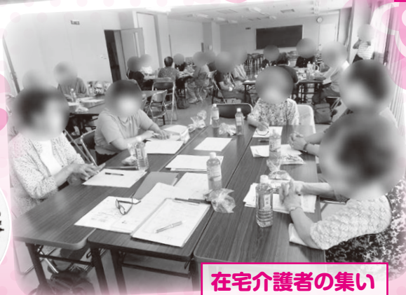
在宅介護者の集い