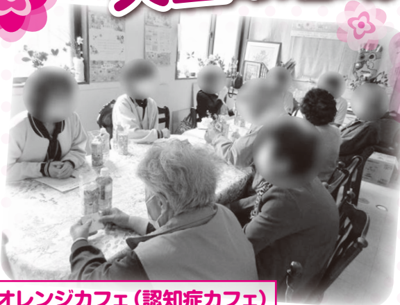
オレンジカフェ(認知症カフェ)

認知症になっても安心して、 自分らしく暮らし続けることができる 共生の地域づくりをめざして