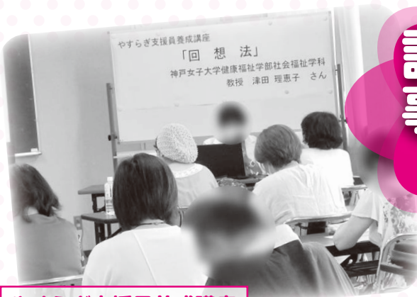
やすらぎ支援員養成講座